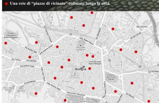
Una rete di "piazzette di vicinato" collocate lungo la città. ...[negoziante 30 anni] "agli italiani piace mangiare fuori... noi vogliamo festeggiare, mercatini fare, chiacchiere, nella strada stare!", per cui si potrebbero ritagliare degli spazi di strada da consegnare permanentemente a funzioni di altro tipo, ...[negoziante 53 anni] "negli angoli complessini che suonano, se tu dai spazio: dalla gente vengono fuori delle belle cose..." e poi periodicamente si potrebbe allestire..." un mercato qui non lo organizza l'ASCOM ma i commercianti della strada stessa...", in fondo Via Mascarella ...[libraio 38 anni] "è un po' una comunità, per chi ci vive è una gran fierezza!"